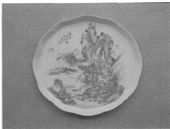
图2 程门款浅绛彩绘山水平底盘修复后