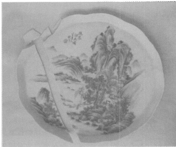
图1 程门款浅绛彩绘山水平底盘修复前