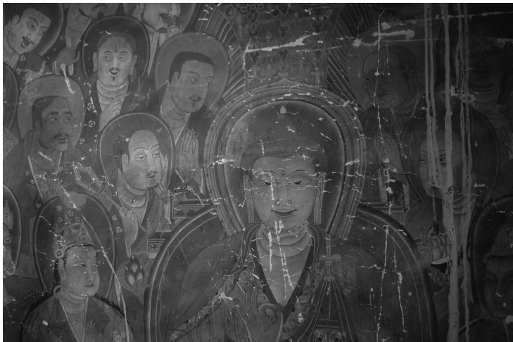
图 5 佛殿壁画