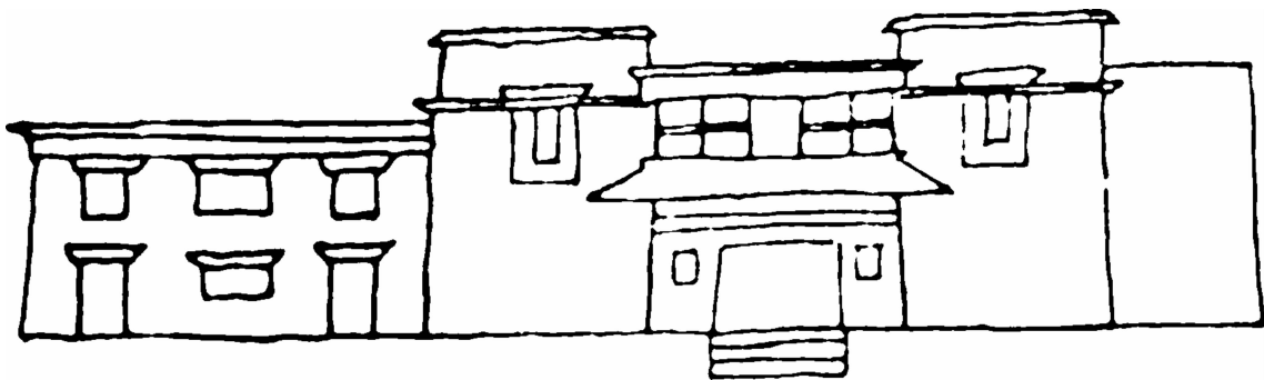
图3 宿白先生绘扎塘寺立面图

1996 年 11 月 20 日，扎塘寺被国务院公布为第四批全国重点文物保护单位。