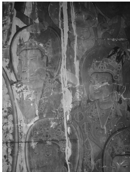
图 6 佛殿壁画