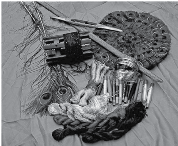
图2 云饰织造时所用的工具及材料

因其最初的织锦图案都为云彩，把同样产自这里的织锦统称为“云锦”，这似乎更贴切。的确，在很多传世品中都以云纹织做底纹，当然也有单独的云纹匹料出现，现在初步有统计云纹的样式就有上百个不同的造型，有躺着的一朵朵的写实云团、有几何拼接的抽象云朵还有人们想象中的云气，造型各异色彩千变万化。站在学术的角度来看，这种理解说服力更强些，《汉武帝内传》也有记载：“张云锦之帔，然九光之灯。”即云锦具有绚丽的色彩。