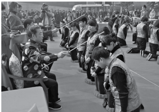
图6 云锦传承人拜师学艺