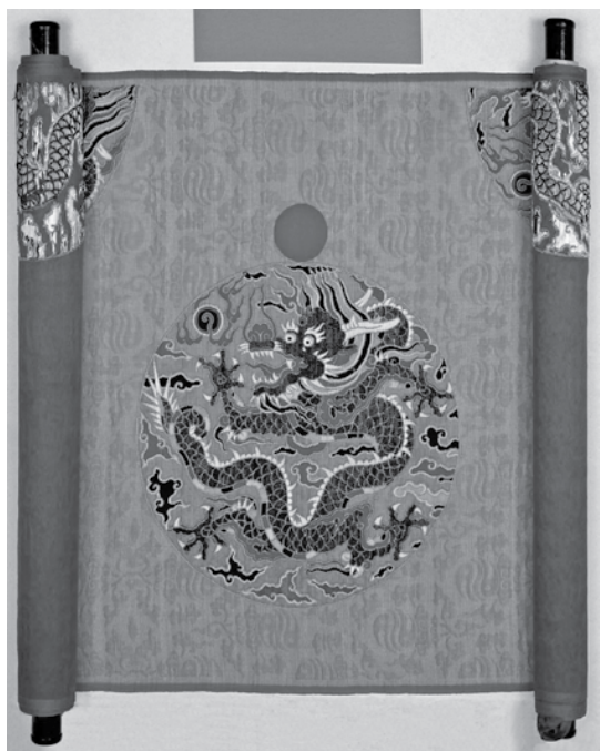
图3 明段金孔雀羽妆花纱龙袍正面局部 (复制)

这件旷世精品出土后也没能躲过她被空气吞噬的宿命，但很快文保工作者进行了抢救性的研究复制工作，云锦博物馆的技术人员在素纱禅衣复制的技术基础上，从研究特殊彩线的孔雀羽线到妆花与纱的技术架接，再到缫丝染色，最后织机装造，历时5年多的时间，终于让这项被泥土掩埋了近300年的技术得以恢复。